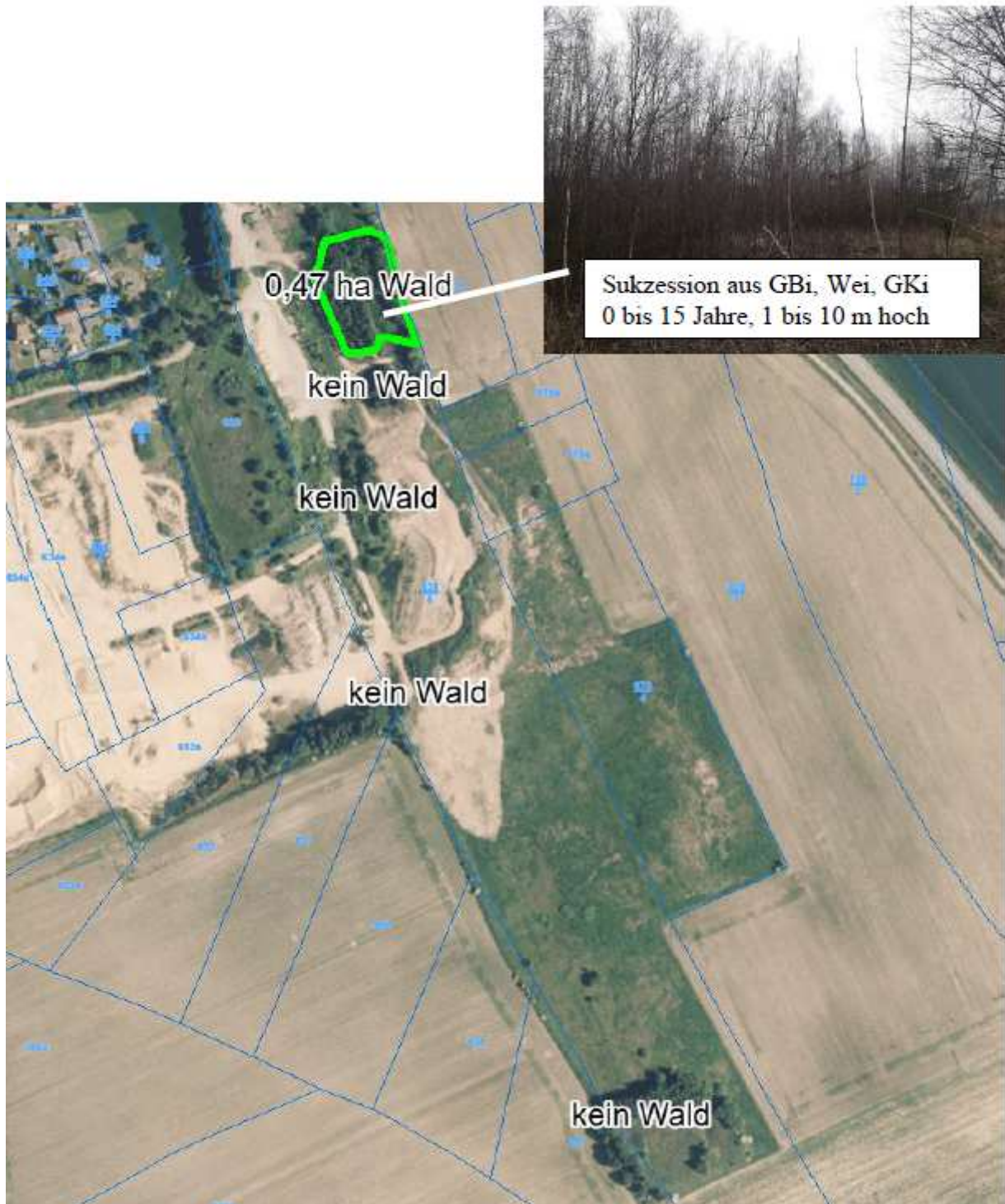
M ca. 1:4000, Gemarkung Oberruppertsdorf Waldfläche außerhalb des B-Plangebietes