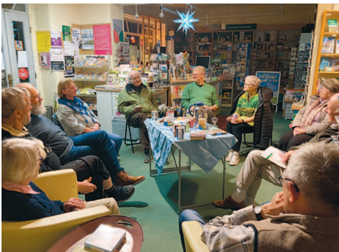
von unserem jüngsten Treffen im März.

Wir freuen uns, dass wir im Laufe der Zeit zu einem festen Kreis von etwa zehn Personen herangewachsen sind und dass auch immer wieder neue Lesebegeisterte unsere Runde entdecken. Der Herrnhuter Literaturkreis ist ein monatliches Angebot der Comenius-Buchhandlung in Herrnhut, das stets offen ist für neue Literaturinteressierte. Es richtet sich an Menschen, die gern mit anderen über Bücher ins Gespräch kommen und dankbar sind für Lektüre-Anregungen.