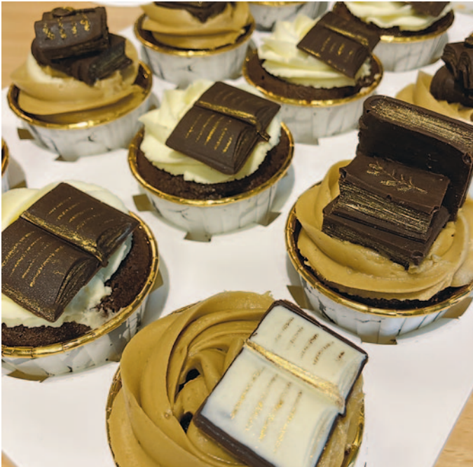
unsere wunderschönen Buch-Muffins (Jubiläumsüberraschung vom 1. Geburtstag)

Im Monat April feiert unser Herrnhuter Literaturkreis seinen 2. Geburtstag. Herzlich laden wir zu unserem Jubiläumstreffen am 9. April 2026 ein. Dazu kommen wir um 19.00 Uhr in der Comenius-Buchhandlung Herrnhut (Comeniusstraße 2) zusammen. In den vergangenen zwei Jahren haben wir sage und schreibe 186 Bücher besprochen. Unser Bestehen nehmen wir zum Anlass, gemeinsam auf die Höhepunkte unserer literarischen Betrachtungen zurückzublicken. Was war für den Einzelnen überraschend und bereichernd?