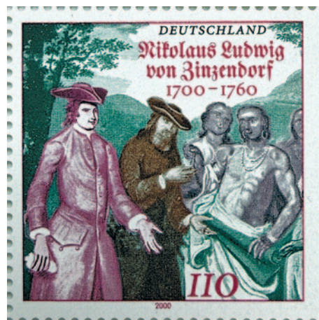
Briefmarke zum 300. Geburtstag von Zinzendorf; sie zeigt seine Begegnung mit den Irokesen 1742 in Pennsylvanien. 2000 | HMH.10891

Zur Ausstellungseröffnung am Sonntag, dem 10.5.2026, um 16.00 Uhr wird herzlich eingeladen!