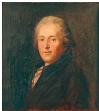
Porträt Görlitzer Sammlungen nach Anton Graf

Ihr Freundeskreis Zinzendorf-Schloss Berthelsdorf