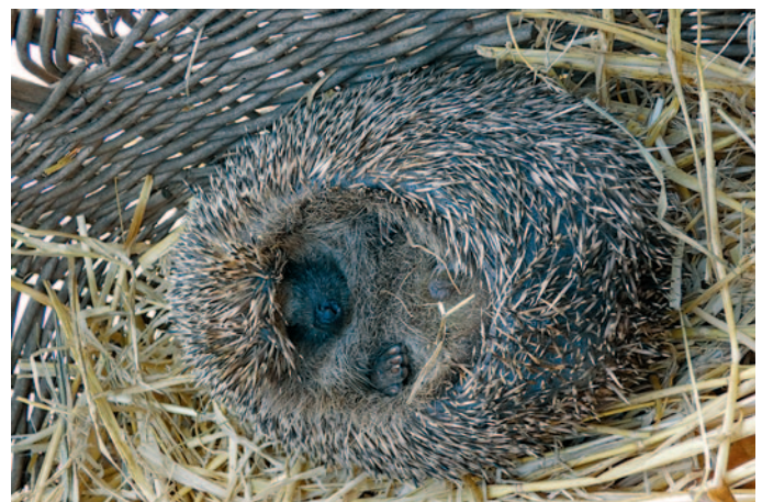
schlafender Igel · Fotos: R. Heinrich