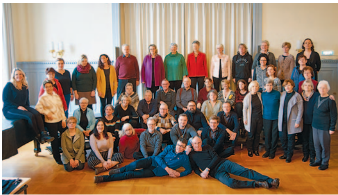
Stadtchor Löbau

Lassen Sie sich überraschen – und vielleicht stimmen Sie auch mal gemeinsam mit uns ein. Am Klavier unterstützt uns Breno Seifert.